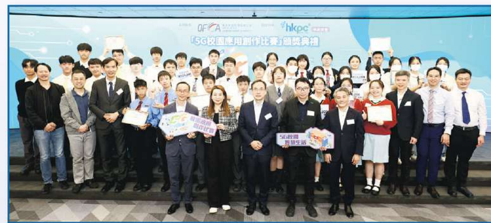
▲繼去年成功舉辦「5G校園應用創作比賽」(圖為去年頒獎典禮)，通訊辦今年再度舉辦是項比賽，邀請全港中學生參與。

基於以上背景，本屆「5G校園應用創作比賽」將聚焦人工智能和5G技術，鼓勵參賽學生發揮創意，將科技應用於學習及日常生活中，讓社區轉變為學習、實驗和展示新想法的平台，進而激發他們日後投身創新科技領域的興趣和熱情。