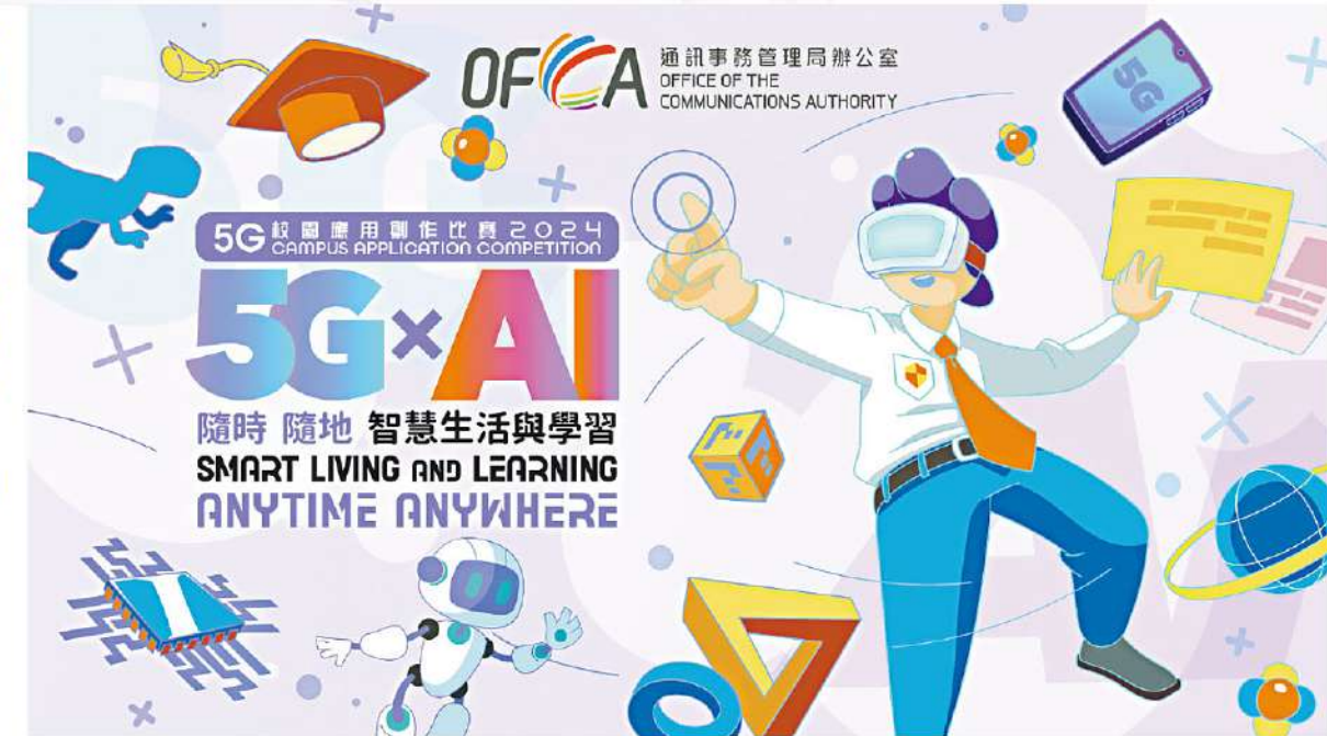
「5G校園應用創作比賽2024」鼓勵學生發揮創意，推動創新科技產業發展，培養新一代科技人才。

繼2023年成功舉辦「5G校園應用創作比賽」後，通訊事務管理局辦公室(「通訊辦」)決定於今年再度舉辦該項比賽，並以「5G X AI - 隨時隨地 智慧生活與學習」為主題，旨在增強本港中學生對5G技術和人工智能(AI)的了解，以及培養他們在科技領域的能力，特別是在STEM方面的綜合應用，藉此提升學生的創新、協作和解決等綜合能力。比賽現已接受報名，歡迎全港中學生組隊參與，報名截止日期為5月31日。