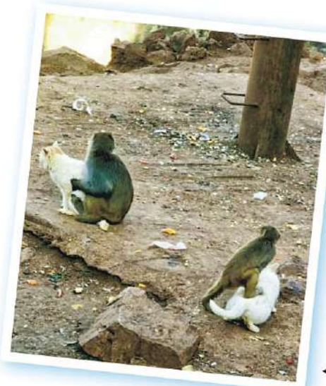
網傳照片顯示，雲南昆明動物園的猴群集體拉扯和玩弄貓。

「中工網」引述北京生物多樣性保護研究中心研究員郭耕稱，「猴貓共處」違反自然，將靈長目動物與食肉目動物關在一起，可能引起兩者