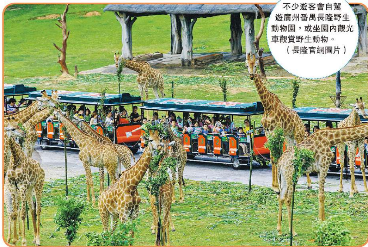
不少遊客會自駕遊廣州番禺長隆野生動物園，或坐園內觀光車觀賞野生動物。

不少人喜歡假期到動物園遊玩，截至2021年，中國內地共有2958所動物園及相關企業。近年有動物園改變經營手法，如設「雲領養」、商場動物園等，使動物園產業規模不斷擴大。