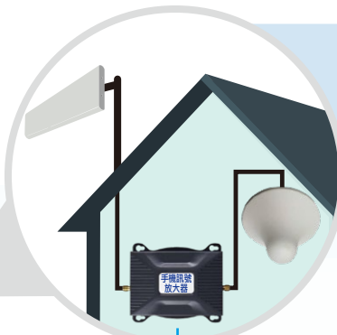
自行安裝的 手機訊號放大器

市民若遇到公共流動服 務接收的問題，應聯絡 其流動網絡營辦商要求 改善，或致電通訊事務 管理局辦公室熱線 2961 6333 尋求協助。