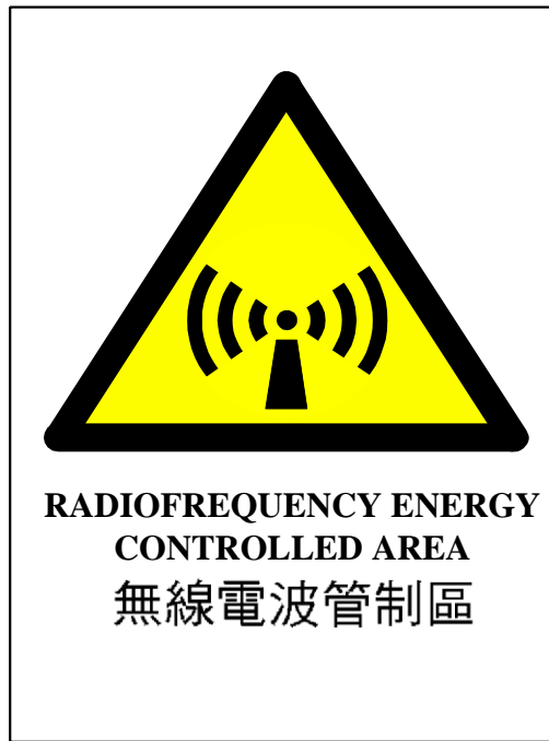
圖 1 非電離輻射警告標誌